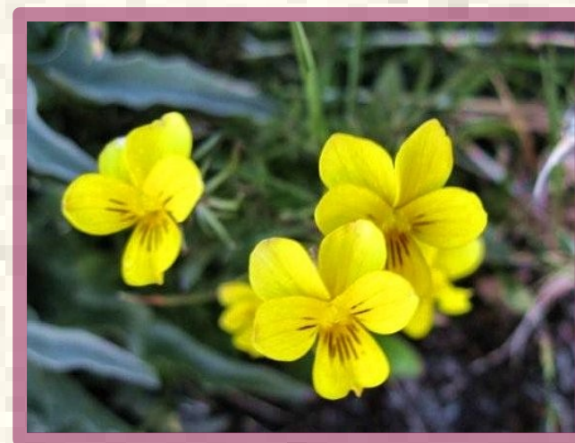
Viola paradoxa Lowe.