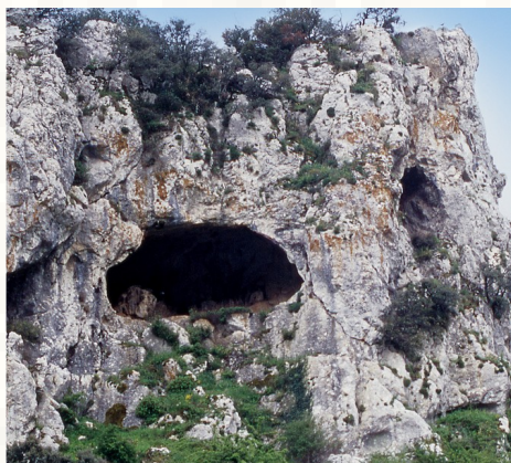
8210 Pendientes rocosas calcícolas con vegetación casmofítica