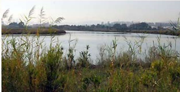
1110 Bancos de arena cubiertos permanentemente por agua marina, poco profunda