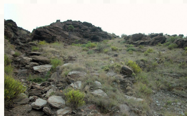
6220* Zonas subestépicas de gramíneas y anuales del Thero-Brachypodietea